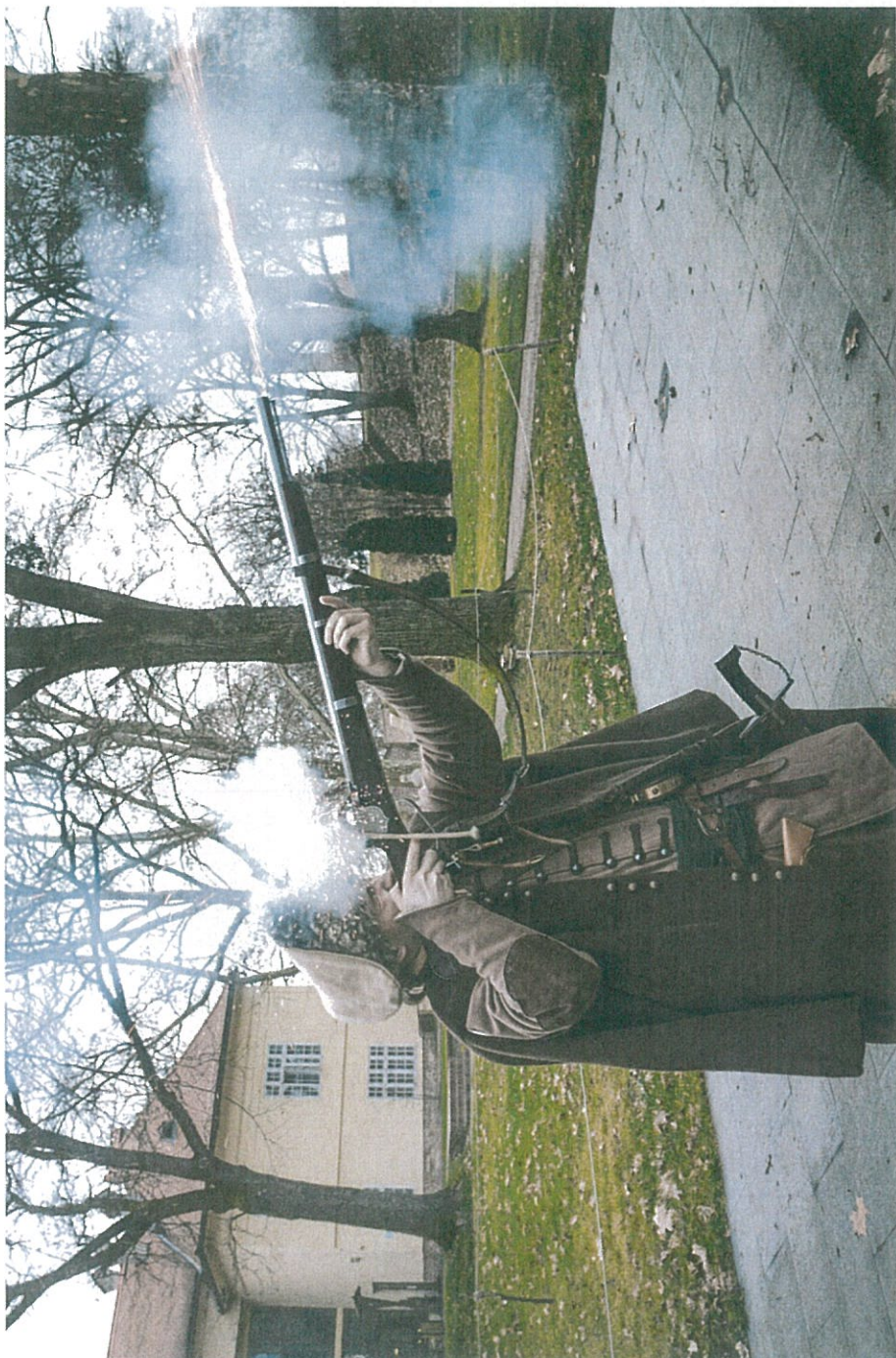
Hagyományőrző díszlövés háttérben a múzeum épületével és a várparkkal