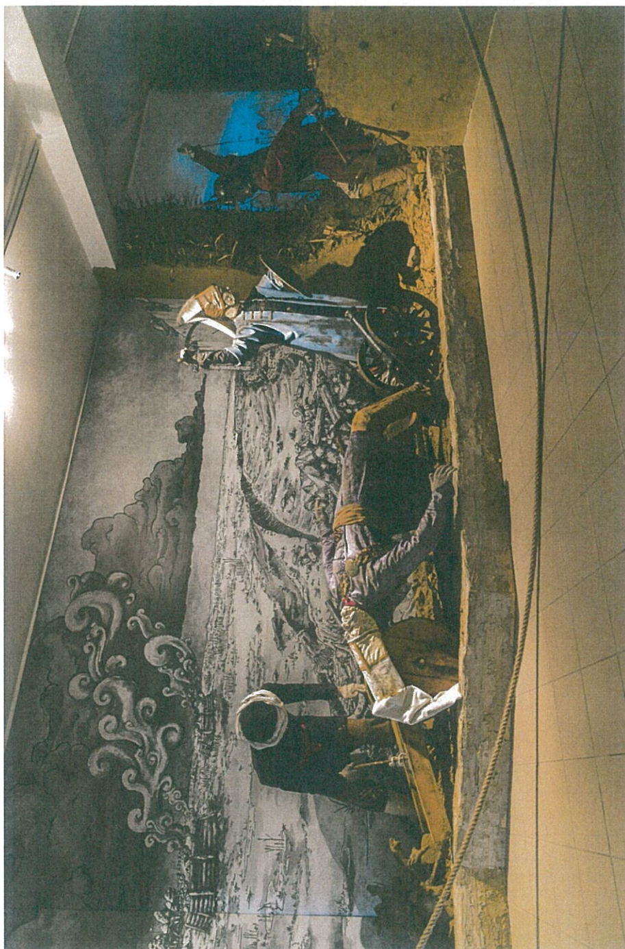
Dioráma a múzeum egyik termében