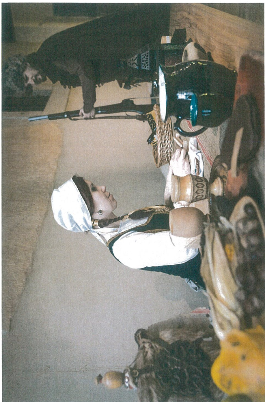
Hagyományőrök kézműves foglalkozást tartanak a múzeum épületében