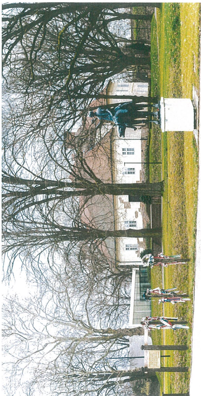
Zrínyi lovas szobra a háttérben a dzsámival és a fogadóépülettel