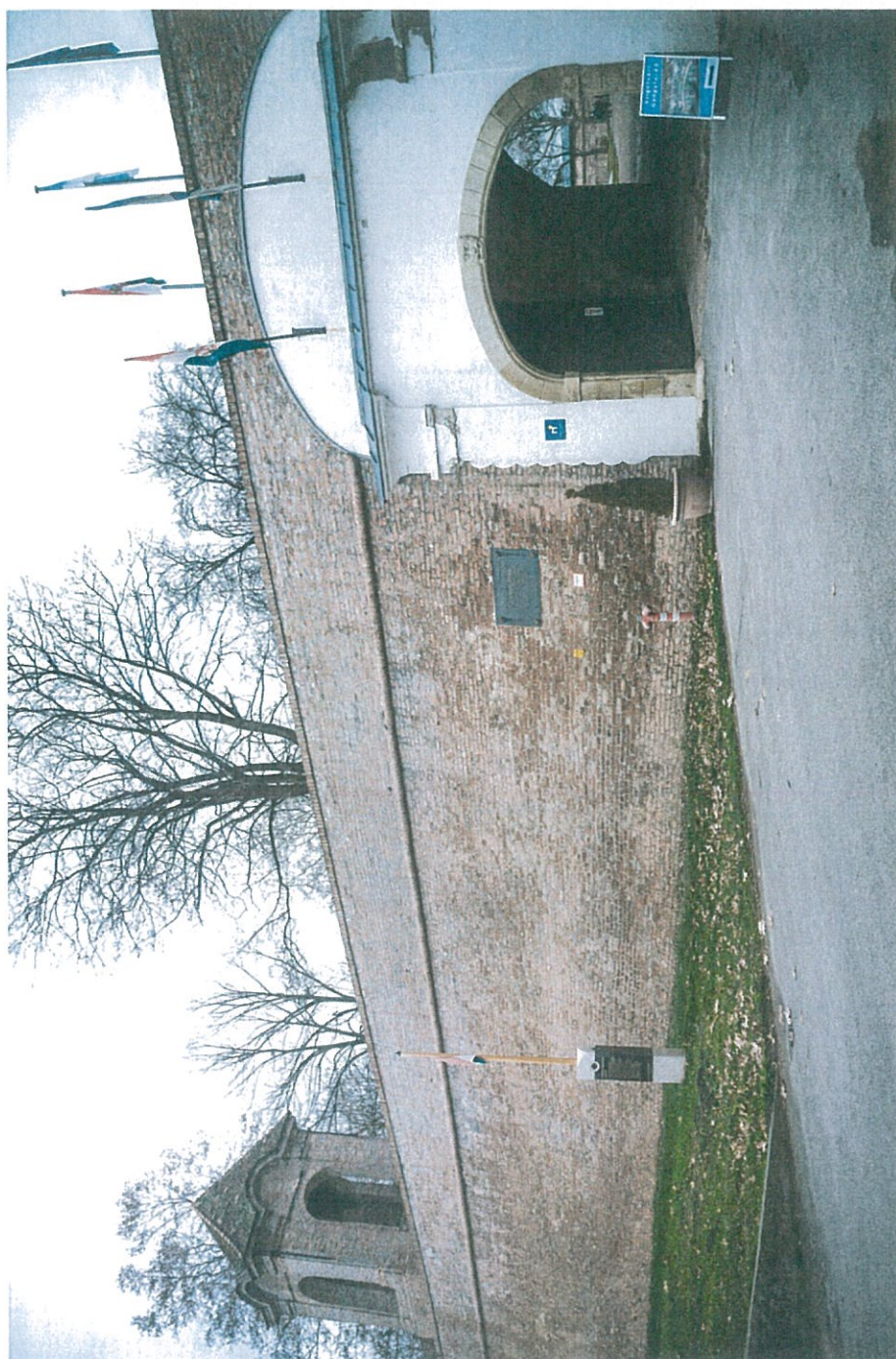
Várkapu a bástyával és a Nemzeti Emlékhelyet jelölő oszloppal