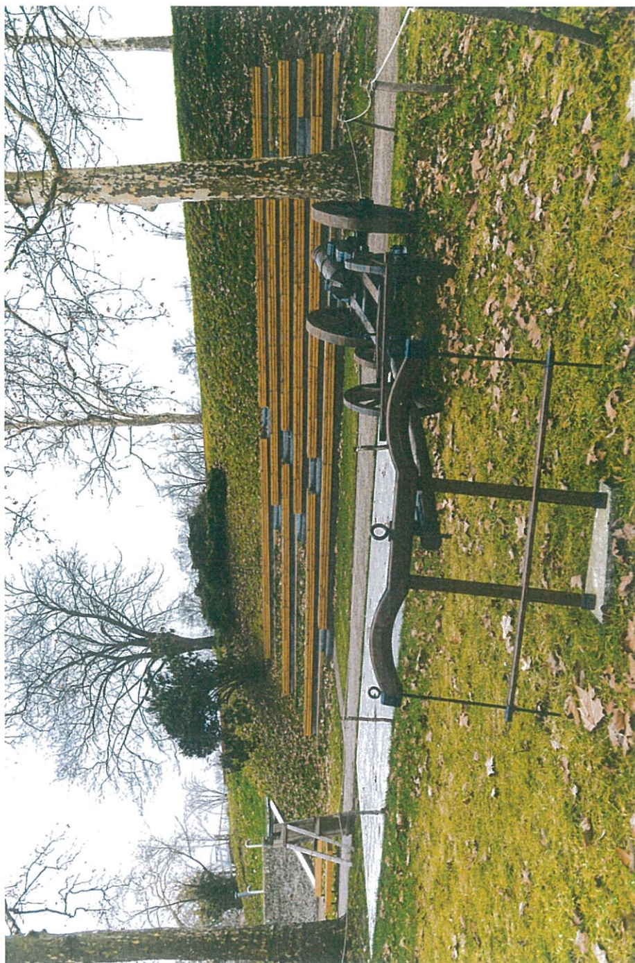
Szabadtéri színpad egy kiállított ágyúval