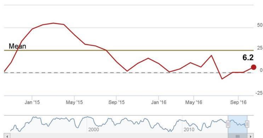
ZEW gazdasági várakozások index 2016. októberben

A német ZEW gazdasági konjunktúra index egyértelműen pozitív várakozásokat mutat a reálgazdasági szereplők részéről. A ZEW gazdaságtudományi intézet frissen közzétett felmérése szerint a gazdasági várakozásokat mérő index értéke 6,2 pontra emelkedett 2016 októberében az egy hónappal korábbi 5,7-es értékhez képest. A nyáron valamelyest visszaeső növekedési kilátások ismét egyöntetűnek látszanak a reálgazdasági szereplők várakozásai szerint Európa vezető gazdaságában. A német gazdaságot a feldolgozóipar és az export jó teljesítményei jellemzik, az optimista várakozásokat azonban a közelgő és az Európai Unió által képviselt gazdasági övezet jövőjében meghatározó választások politikai kockázatai és a pénzügyi rendszer kockázatai árnyékolják be – emeli ki a ZEW elemzése.